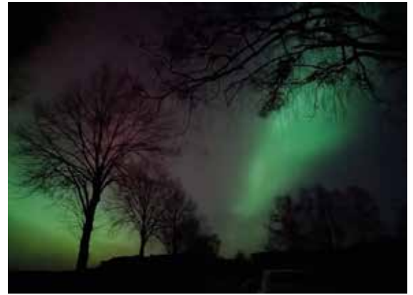
Polarlichter über dem Seeberg in unterschiedlichen Farben am 19. Januar.

Das Polarlicht (wissenschaftlich Aurora borealis) ist eine Leuchterscheinung durch angeregte Stickstoff- und Sauerstoffatome der Hochatmosphäre, also ein Elektrometeor. Polarlichter sind meistens in etwa 3 bis 6 Breitengrade umfassenden Bändern in der Nähe der Magnetpole zu sehen.