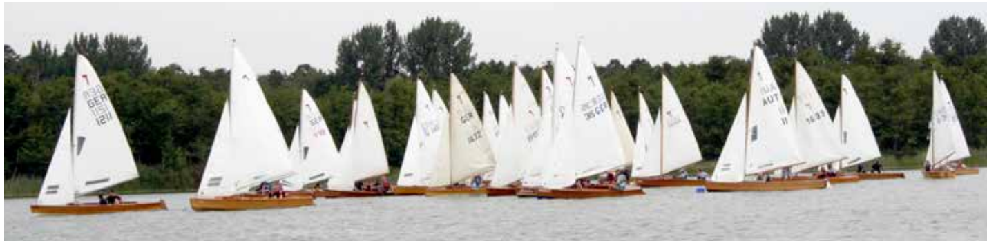
Beeindruckendes Feld: 2022 schwärmte die Armada von 31 Holzpiraten über den Großen Lychensee

Für den Seglerverein Lychen wird das Jahr 2026 wieder sehr ereignisreich. Zurzeit bereiten Trainer aus 6 regionalen Vereinen für den Nachwuchs ein kurzes Segelcamp über das Himmel-fahrtswochenende vor. Nach