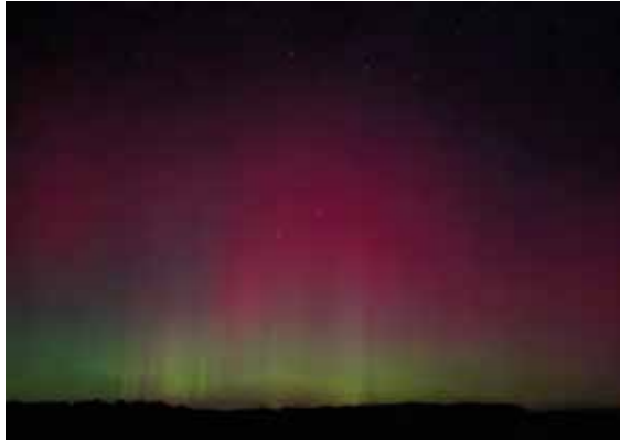
Bereits 11. Januar waren am nördlichen Himmel Polarlichter zu sehen.

Hervorgerufen werden sie durch energiereiche geladene Teilchen, die mit dem Erdmagnetfeld wechselwirken. Dadurch, dass jene Teilchen in den Polarregionen auf die Erdatmosphäre treffen, entsteht das Leuchten am Himmel.