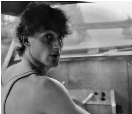
Der gesuchte Lychener im Jahr 1986 auf einem Privatboot. Im Hintergrund ist die Eisenbahnbrücke am Großen Lychensee zu sehen.