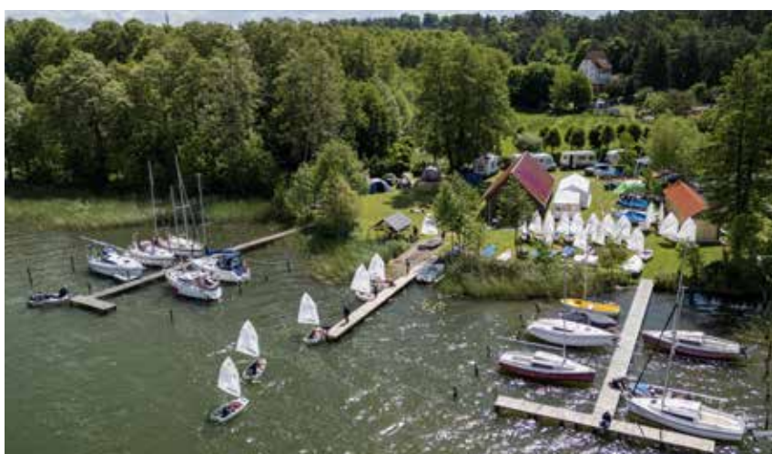
Über dem Lychener Segelcamp 2025

2024 und 2025 am Großen Lychensee treffen sich zahlreiche Kinder und Jugendliche mit ihren Trainern und betreuenden Eltern Mitte Mai beim Seglerclub Templin. Es geht hier um Kennenlernen, Sport und Spielen, Zelten,